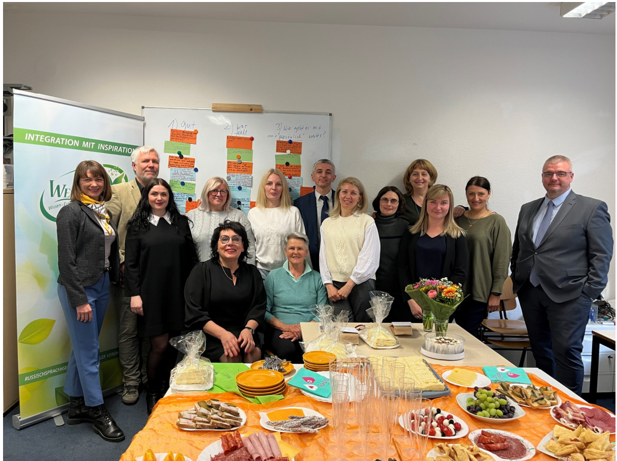
Abschlussveranstaltung 31.03.2025